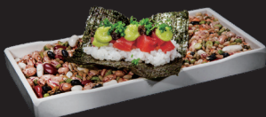
56 Temakizushi tuna truffile

tonno, avocado, phila, salsa tartufo, erba cipollina.